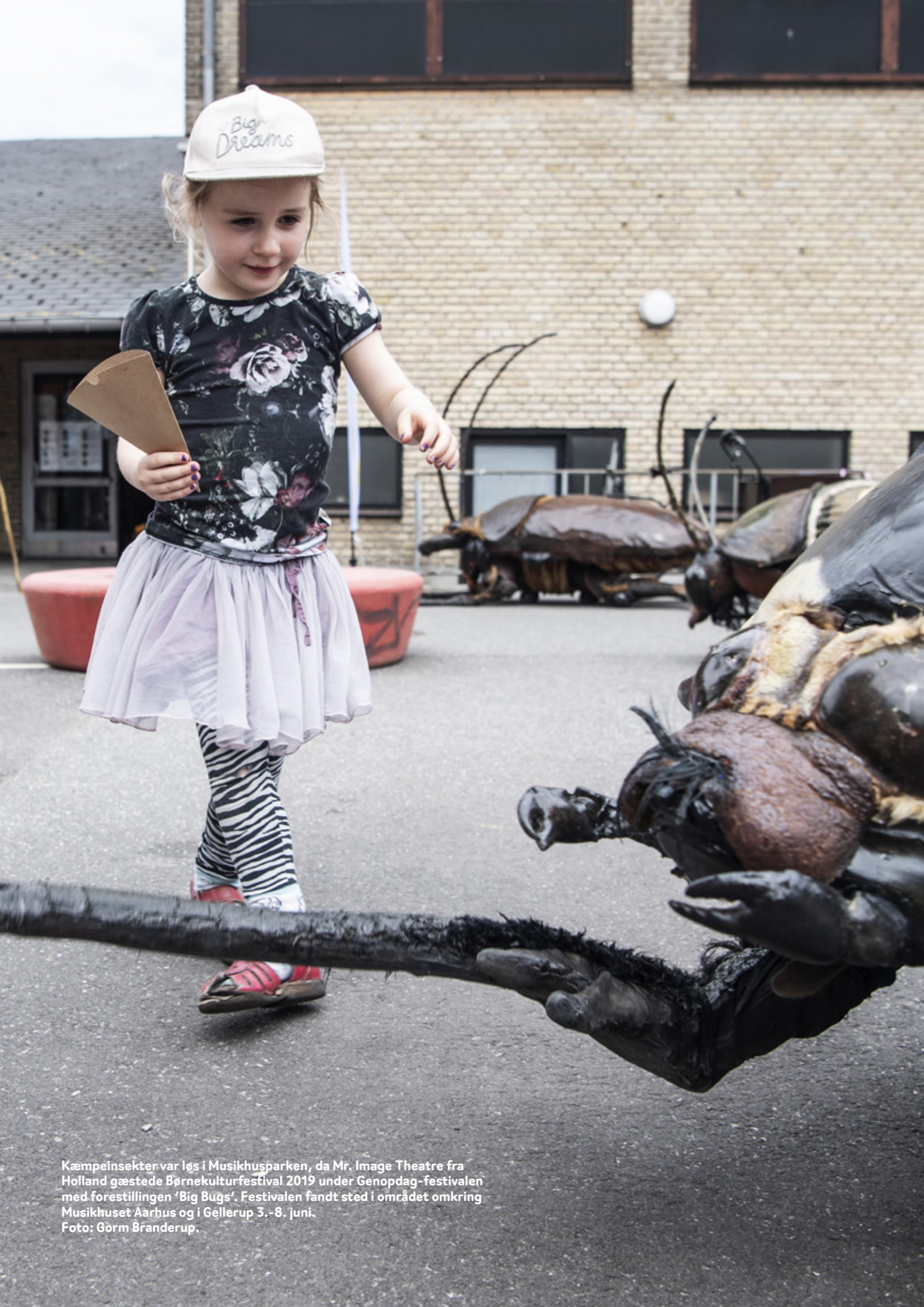
Kæmpeinsekter var løst i Musikhusparken, da Mr. Image Theatre fra Holland gæstede Børnekulturfestival 2019 under Genopdag-festivalen med forestillingen 'Big Bugs'. Festivalen fandt sted i området omkring Musikhuset Aarhus og i Gellerup 3.-8. juni.