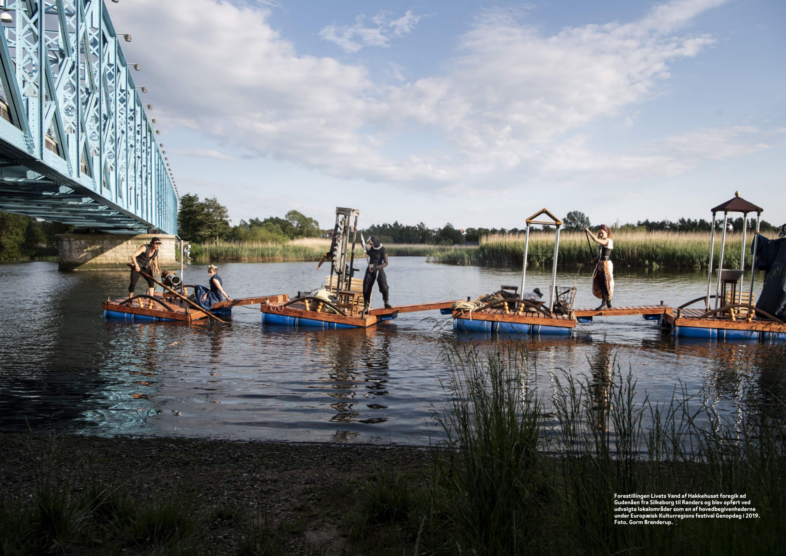
Forestillingen Livets Vand af Hakkehuset foregik ad Gudenåen fra Silkeborg til Randers og blev opført ved udvalgte lokalområder som en af hovedbegivenhederne under Europæisk Kulturregions festival Genopdag i 2019.