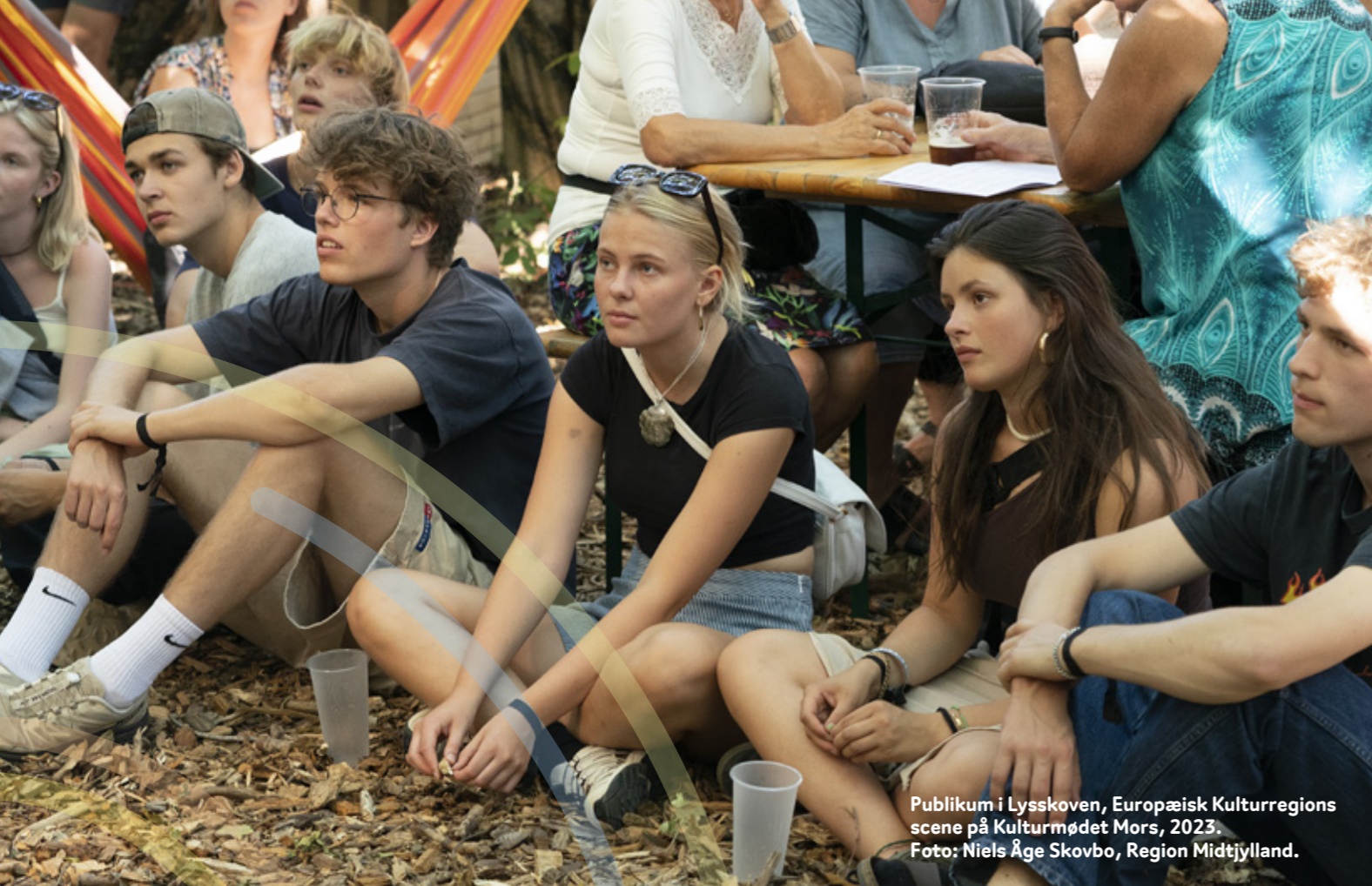
Publikum i Lysskoven, Europæisk Kulturregions scene på Kulturmødet Mors, 2023.